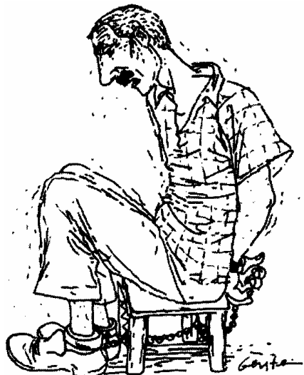
Abb. 6: »Shabeh«, eine typische Foltermethode. Public Committee Against Torture in Israel, Back to a Routine of Torture, S. 55.