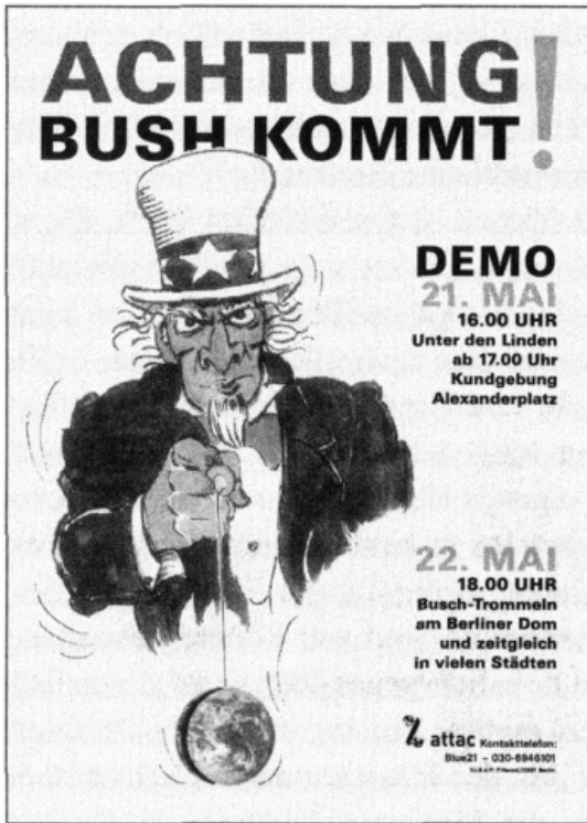
Abb. 1: »Das bekannte Bild von ›Uncle Sam‹ zeigt eine ›typisch jüdische Nase.«