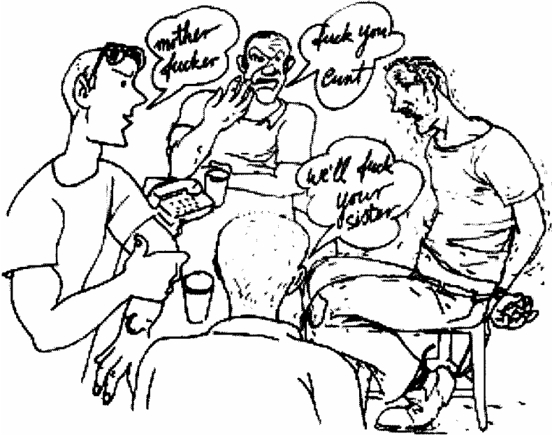
Abb. 5: Demütigung während des Verhørs. Public Committee Against Torture in Israel, Back to a Routine of Torture: Torture and Ill-treatment of Palestinian Detainees during Arrest, Detention and Interrogation, September 2001 – April 2003, Jerusalem, April 2003, S. 51.