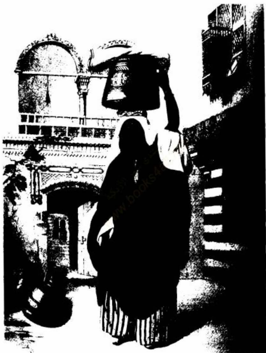
(الشكل رقم ٢١)

سيده من العامة في القاهرة، عائدة من الحمام.