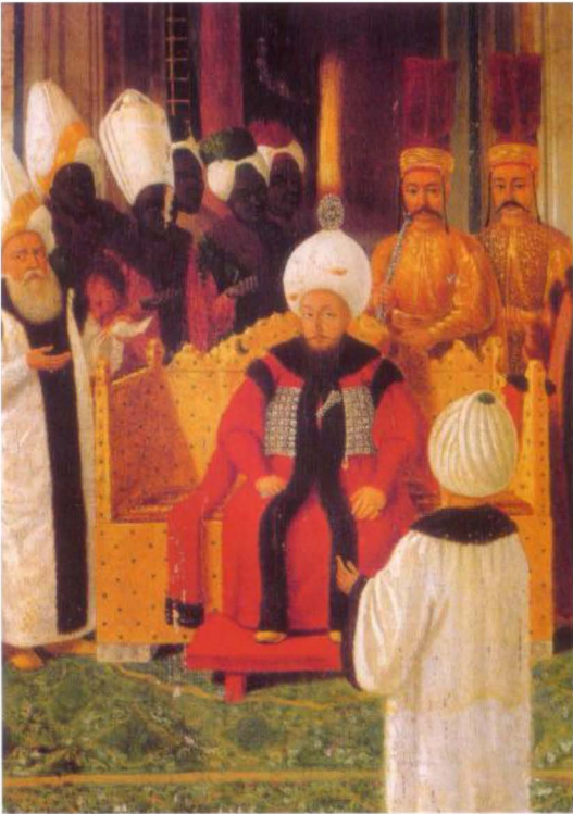
(الشكل رقم ١٢)

سلطان سليم الثالث، يستقبل الوفود المهتنة بمناسبة تتويجه، ويتضح في الصورة الأنماط المتباينة لغطاء رأس كبار الموظفين والحاشية. قسطنطين كبيدغلي، حوالي ١٧٨٩.