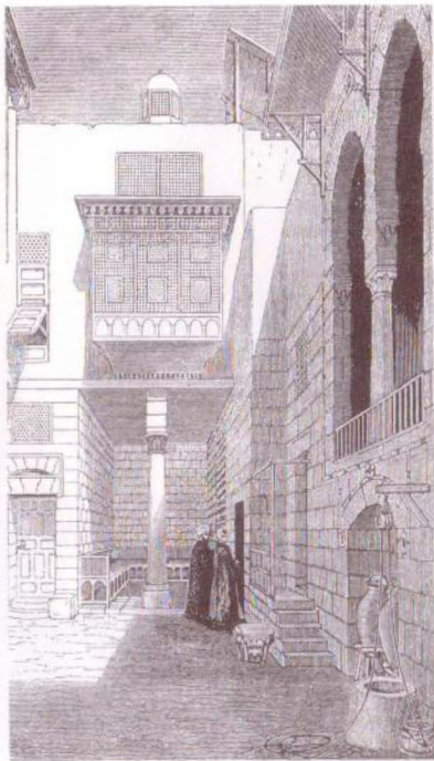
(الشكل رقم ٦)

فناء منزل في القاهرة يمتاز كبقية الأبنية بالخصوصية وفصل الخاص عن العام.