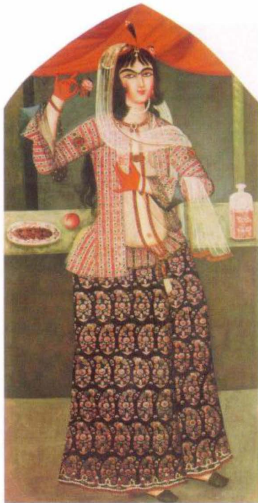
(الشكل رقم ١٥)

امرأة فارسية معقودة الحاجبين ومطلية اليدين بالحناء. الفنان مجهول. إيران، الربع الأول من القرن التاسع عشر.