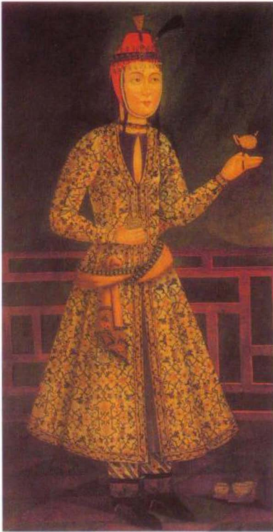
(الشكل رقم ١٤)

أحد أشكال غطاء الرأس عند النساء في فارس، بحلية على شكل ريشة، وخيط من اللؤلؤ يتدلى أسفل النقن. الفنان مجهول، اصفهان ١٧٠٤ - ٢٢.