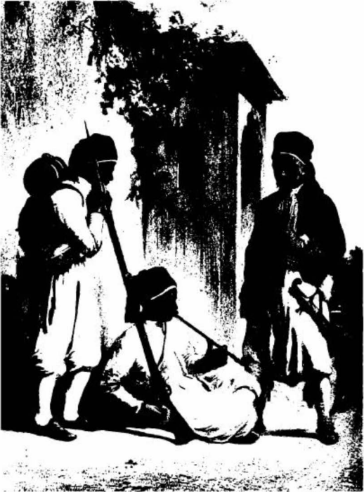
(الشكل رقم ١٨) جيشاوية يدخنون التبغ. اي. بيرسي، ١٨٤٨.