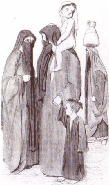
(الشكل رقم ٤)

نساء من الطبقات الفقيرة في القاهرة يحملن أطفالهن وجرار الماء.