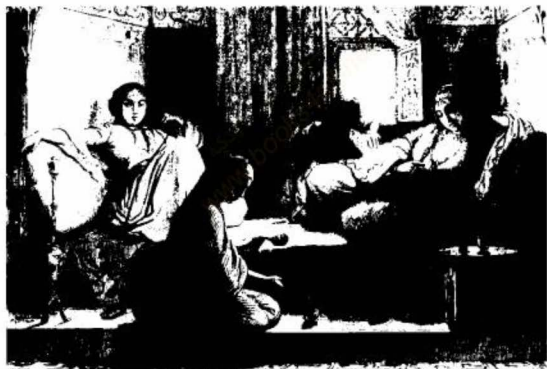
(الشكل رقم ١٩)

سيدات في حرم في القاهرة يدخن التبغ باستخدام الغليون الذي كان يعرف باسم «الشيك» أو العود. إدوارد لين، ١٨٣٣ - ١٨٣٥.