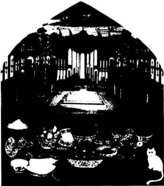
(الشكل رقم ١٦)

طبيعة ساكنة تصور وجبة الغداء المتألّفة من الفواكه، ومنتجات الألبان، والخبز، ضمن إطار حديقة قصر. الضنان مجهول، إيران، أوائل القرن التاسع عشر.