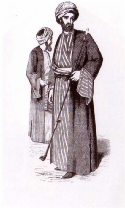
(الشكل رقم ٨)

رجال من الطبقات المتوسطة والعليا في القاهرة، متسربلان بطبقات متتالية من الثياب.