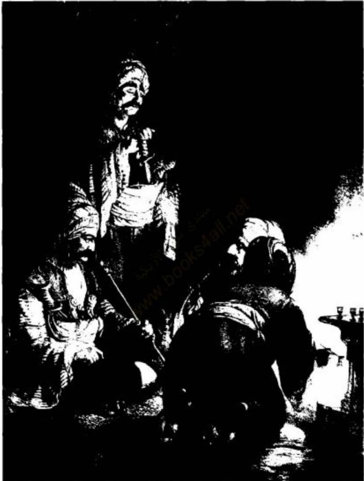
(الشكل رقم ١٧)

استراحة قافلة. تجار أتراك يقضون وقت الاستراحة في شرب القهوة وتدخين التبغ. توماس ألوم، تركيا ١٨٤٠م.