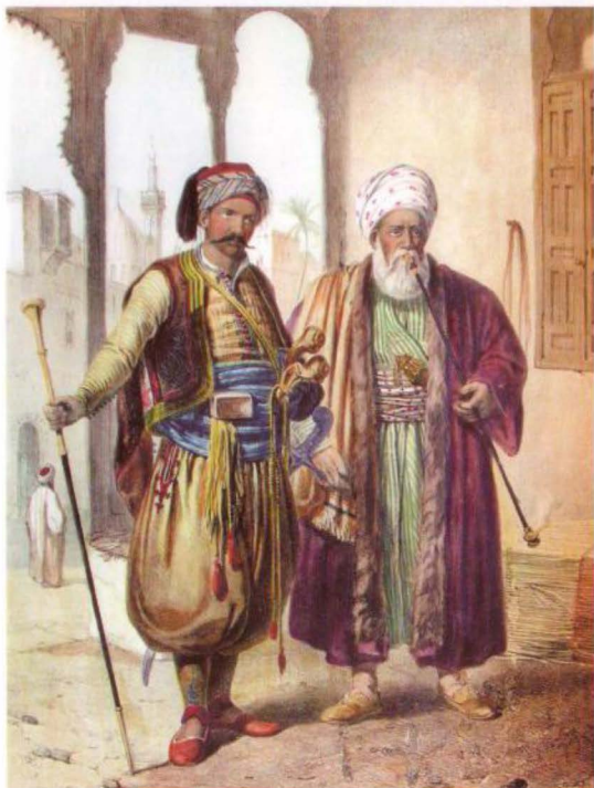
(الشكل رقم ١١)

شكلا غطاء رأس لجاويش عثماني، وتاجر مصري في القاهرة.