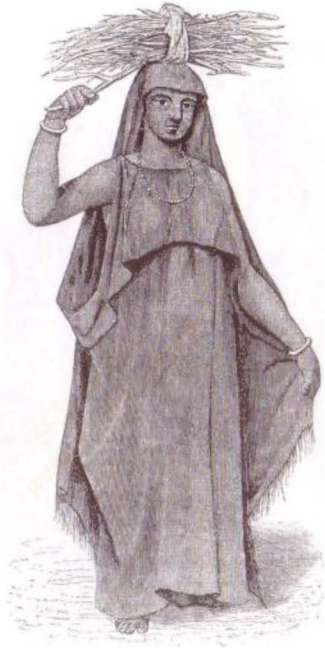
(الشكل رقم ٣)