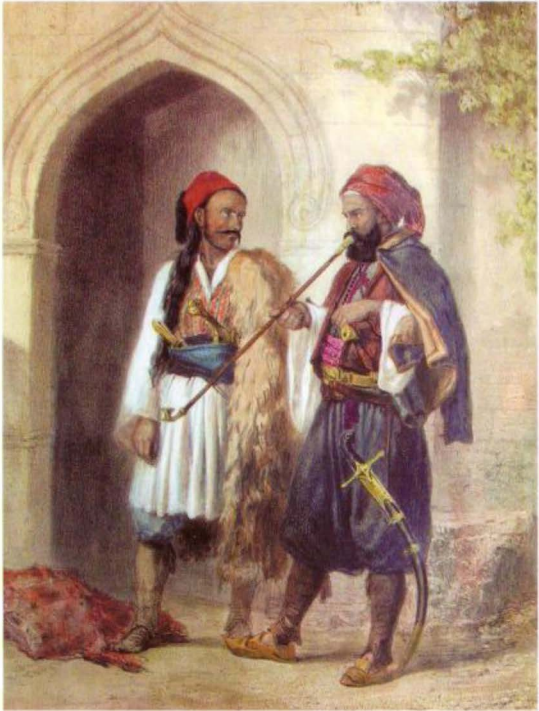
(الشكل رقم ١٠)

القاهرة، جندي عثماني وآخر أرناؤوطي، يداان خنجريهما وطبنجتيهما في ثنية الحزام. اي. بيرسي، ١٨٤٨.